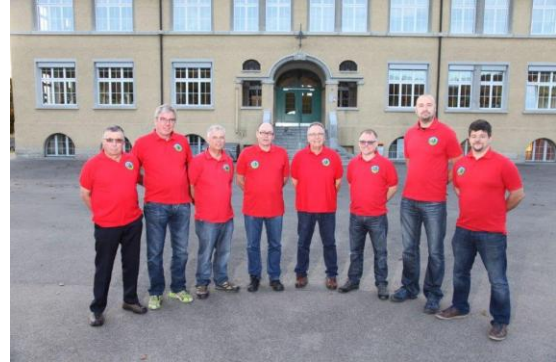
Das OK-Team Schweiz. Handdruckspritzen Wettbewerb-HDSW-2018

Schweizweit werden uns Teilnehmer, Besucher und Gäste die Ehre erweisen und Ihnen eine Wettkampftadition erster Güte präsentieren aber auch Jung und Alt, einmalige und bleibende Erlebnisse bieten.