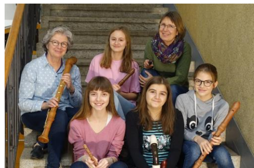
Von Elena Müller, Anouk Dähler